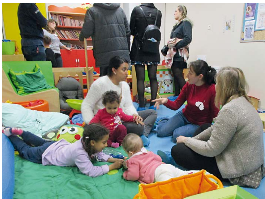
→ Dans la salle des matinées Arc-en-Ciel, enfants, parents et assistantes maternelles échangent avec animation lors de la soirée Portes ouvertes du RPE...

Les assistantes maternelles de la MAM à la Campagne ont témoigné de leur parcours lors de la soirée création d'activité au centre social Agora le jeudi 13 octobre. Cette Maison d'assistantes maternelles