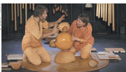
→ A la fin de ce spectacle, les tout petits (à partir de 18 mois) peuvent à leur tour manipuler la glaise.

L'Autre de Moi est un spectacle qui puise dans les berceuses liées à l'écoute et au toucher. L'expression vocale est associée à une empreinte visuelle et tactile. Se produisant alors des instants de rêverie : le façonnement de la glaise traversé par le chant, un corps-à-corps partagé entre les deux interprètes chanteurs, musiciens et pétrisseurs. À l'issue d'un premier spectacle au musée, les (très) jeunes spectateurs pourront mettre eux-mêmes la main à l'argile.