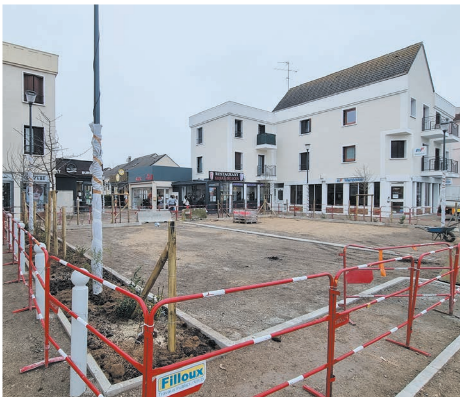
→ Place Seguin, les plantations ont été réalisées début décembre et il ne reste plus que le revêtement bitumé définitif à faire.

À partir du 6 janvier la place Seguin sera de nouveau neutralisée pour permettre les allées et venues des engins de chantier