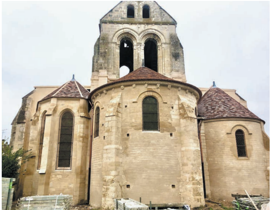
→ Jeudi 12 décembre, le chevet de l'église Saint Etienne se dévoile, avec son revêtement à la chaux et les toitures du chœur et des chapelles rénovées. NB : la rénovation du clocher fait partie de la dernière tranche des travaux extérieurs.