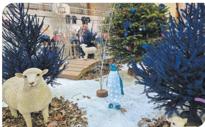
Une décoration féerique réalisée par les services techniques.