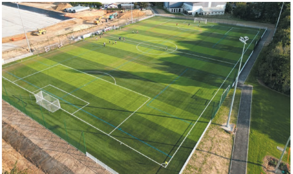
→ Au stade Auguste-Delaune le terrain d'honneur est en service depuis septembre.

Si cette subvention est confirmée, le reste à charge pour la ville sera de 1 495 322,70 €.