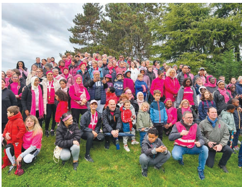
» En 2024, la Rando Rose a commencé sous une pluie fine, mais cela n'a pas découragé les marcheurs. Ici une pause photo au parc des Trois Collines.

Comme l'an dernier, quatre associations locales animent l'après-midi. À 13h15, cela commence par l'échauffement mené par Fit Move Body. À 13h45, Les Marcheurs de Fosses vous invitent à les suivre pour la boucle que vous aurez choisie : 3 km pour les un.es, 8 km dont une partie en forêt pour les autres. Au retour sur la place du 19-Mars-1962, après vous être désaltéré et avoir fait le tour des stands, vous pourrez continuer à bouger avec la zumba participative de L'Ecam à 16h15 (environ...). Et pour finir, c'est Let's dance qui offre une démonstration de hip-hop.