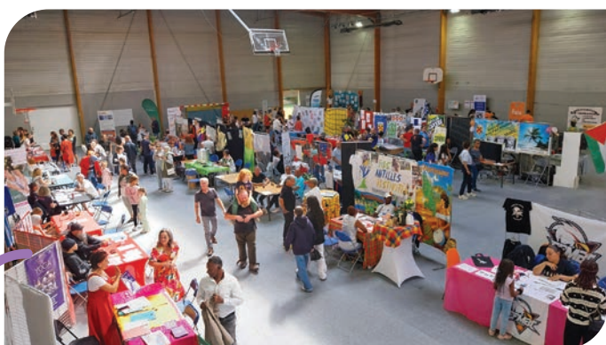
Quelques stands vus de la tribune.

Ce samedi 6 septembre, au gymnase Cathy Fleury et autour du stade, une cinquantaine d'associations proposent leurs activités aux habitant.es prêt.es à s'impliquer, se lancer, se ressourcer, progresser, s'instruire ou s'amuser tout au long de l'année.