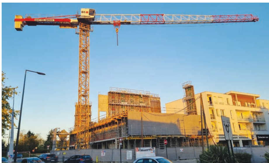
→ Le chantier de construction du nouveau cinéma de l'Ysieux fin septembre.

Inauguré en 1988, le cinéma de l'Ysieux a drainé des milliers de spectateurs durant 36 ans. Cependant, il ne correspondait plus vraiment aux standards des cinémas de proximité d'aujourd'hui et aux habitudes de leur clientèle. La Communauté d'agglomération Roissy Pays de France, qui en est maintenant propriétaire, a choisi de le démolir pour le reconstruire en plus beau et plus grand.