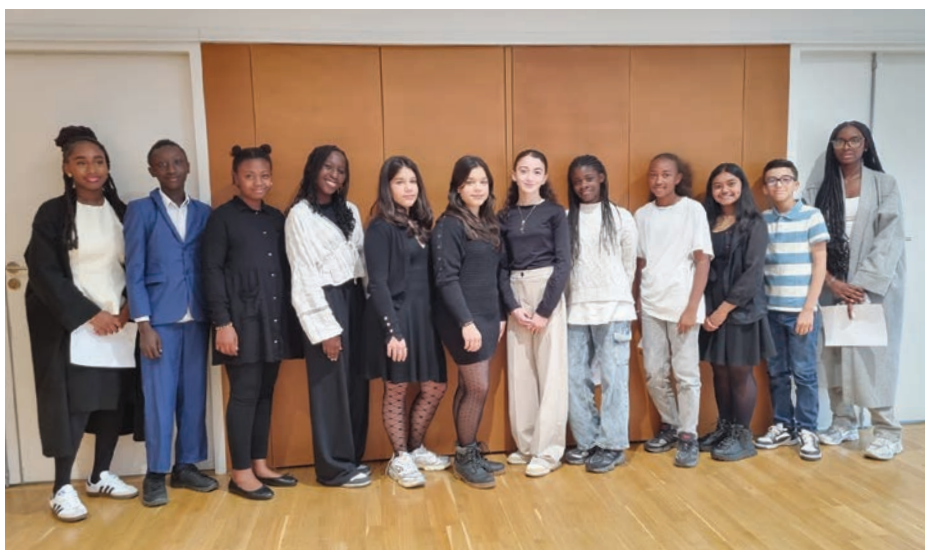
→ Les 12 membres du nouveau Conseil municipal des jeunes juste avant leur investiture.

Un nouveau conseil municipal des jeunes (CMJ) constitué de 12 jeunes Fossatussien.nes de 11 à 15 ans est investi le jeudi 2 octobre 2025 en mairie. Fosses Mag a rencontré ses membres, prêt.es à s'impliquer pour la cité.