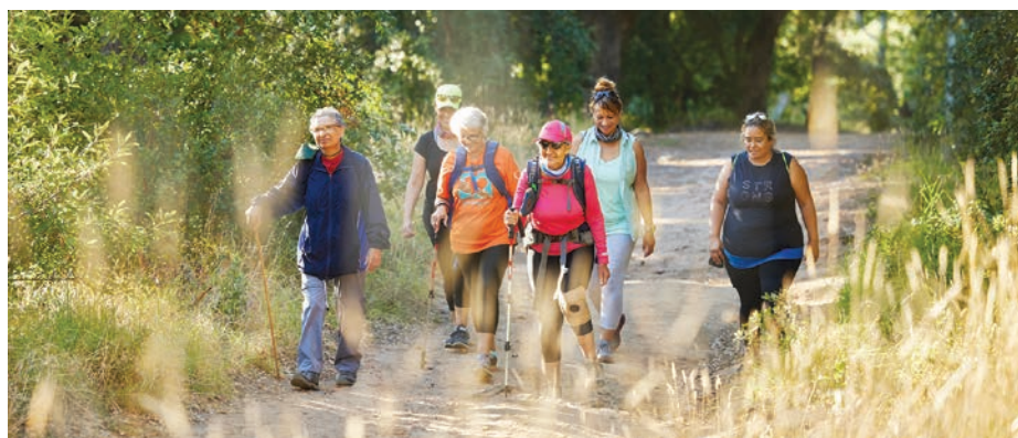
» Foyer Bouquet d'automne, Place Taslima Nasreen (accessible par l'avenue de la Haute-Grève, en face de la gendarmerie, ou par l'allée piétonne Gisèle-Halimi). Tél. 01 34 72 72 72.